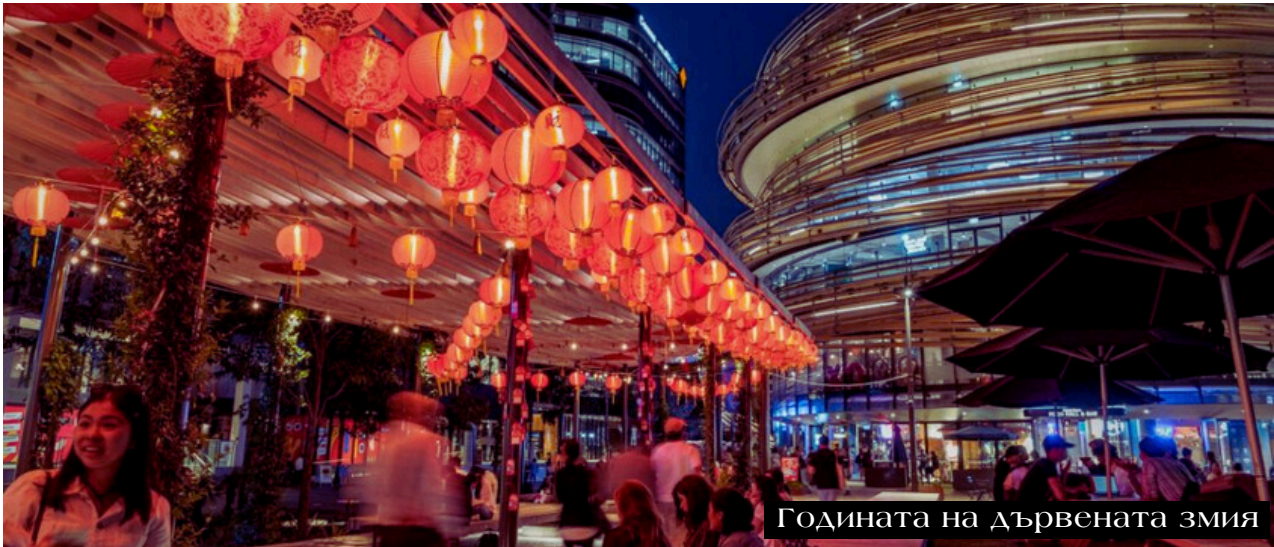
Годината на дървената змия

Българската културна и обществена асоциация